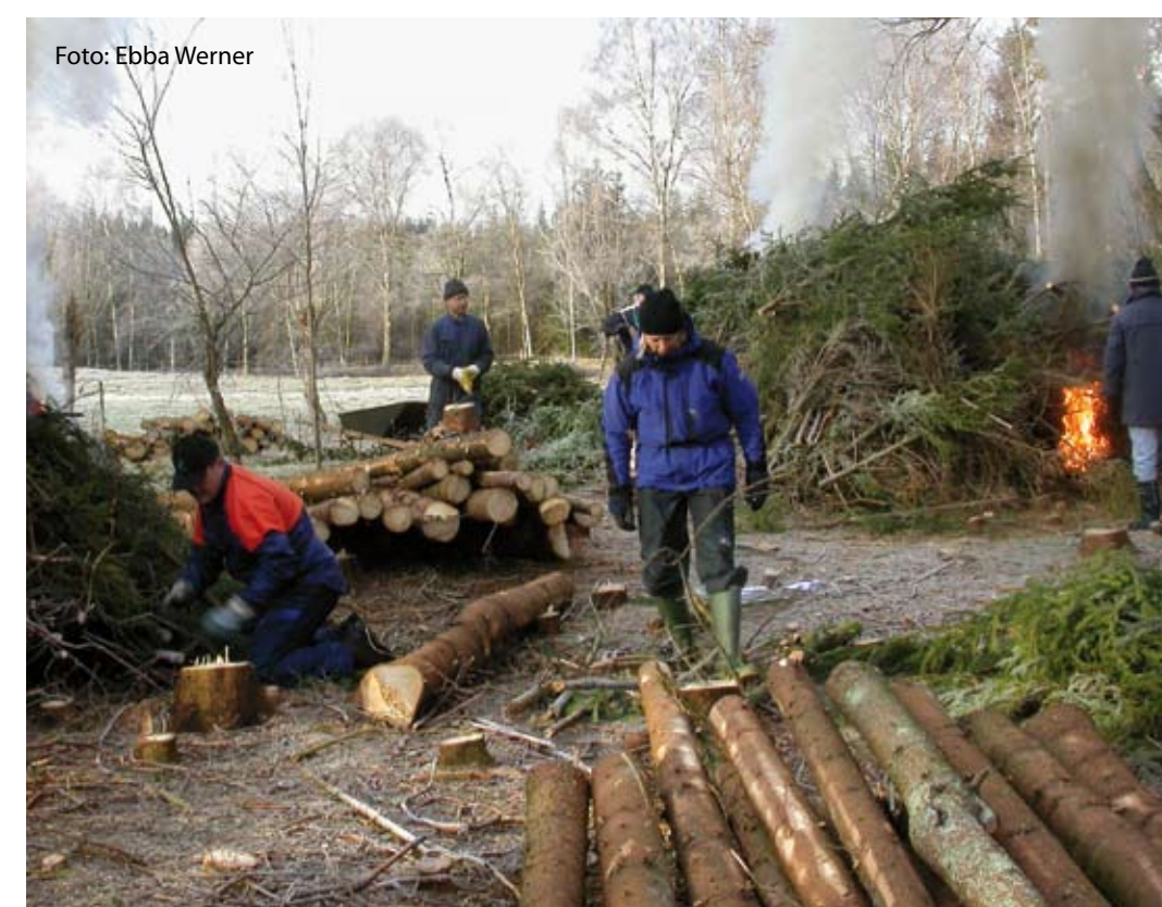
Granskogen avverkas och ger plats för det ljusöppna landskapet