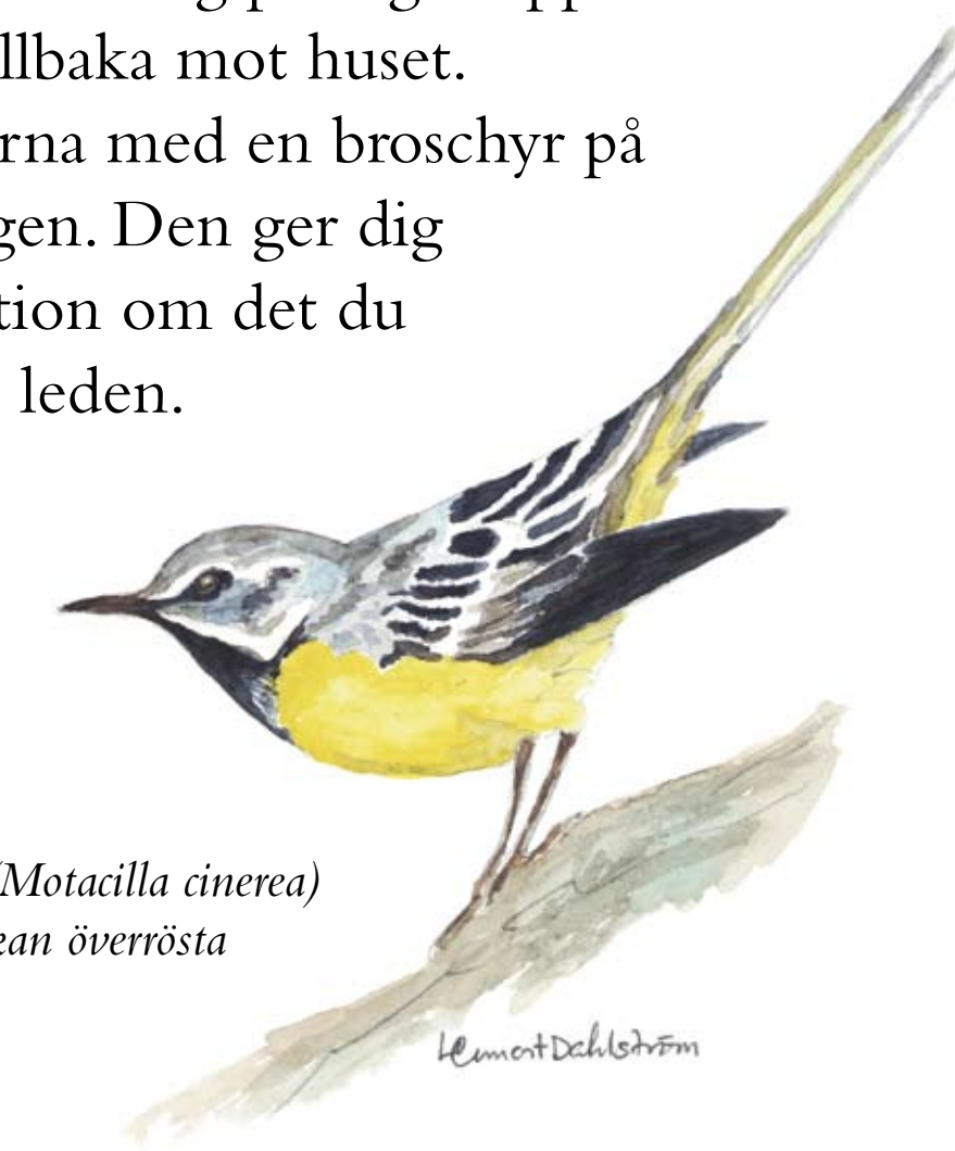
Forsärlans ( Motacilla cinerea ) starka läte kan överrösta forsens brus

Leden börjar på gårdsplanen. Den är rödmarkerad och är 2,5 km lång. Du går först längs Fylleån. Här är leden delvis spångad. Sedan går den längs naturbetesmarker och skog på stigar upp över heden tillbaka mot huset. – Tag gärna med en broschyr på vandringen. Den ger dig information om det du ser längs leden.