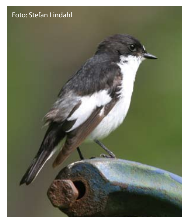
Svartvit flugsnappare ( Ficedula hypoleuca ) gynnas av alla fågelholkar

Under många år sköttes fastigheten av Halmstads Ornitologiska Klubb. Idag sköts den av en grupp inom Naturskyddsföreningen, Björkelundsgruppen, som år 2003 fick Halmstads kommuns miljöpris för sitt arbete här.