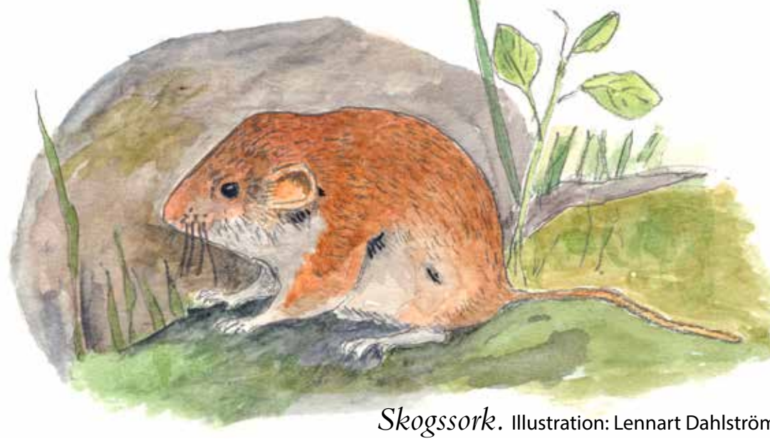
Skogssork. Illustration: Lennart Dahlström

- Bara jag inte blir kattugglemat, som grannen blev igår kväll! Men humledrottningen som kan flytta in i hennes bo blir nog glad!