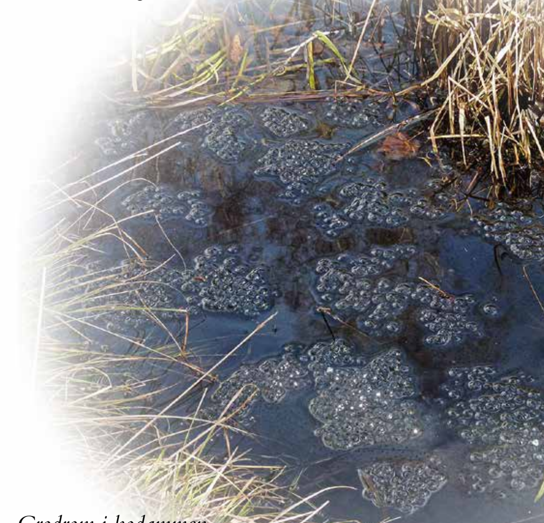
Crodrom i kodammen. (12-03-30).

Tage: - Vad mycket grodrom! Ska vi ta med oss lite och se hur de utvecklas? Rose-Marie: - Så kul, men vad skall vi mata dem med? När grodynglen börjar få ben tycker jag dom skall få komma hem till sin damm igen.