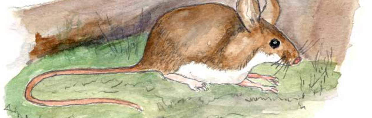
Större skogsmus. Illustration: Lennart Dahlström

- Hej där! Jag bor här så jag vet att det är skogsbjörnmossans sporkapslar. När mössorna ramplar av kommer sporer ut. Du får faktiskt själv klura ut vad de är till för. Jag måste hinna äta mina kottefrön.