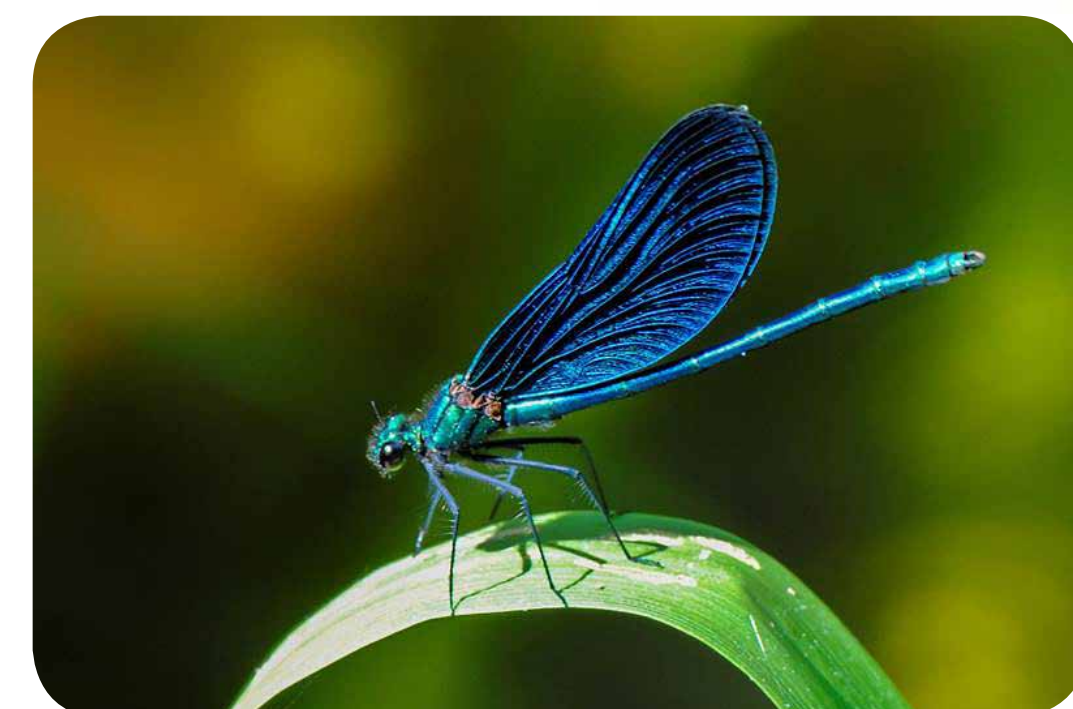
Blå jungfruslända.

Rose-Marie: - Oj vad vattnet forsar därute. Har du tänkt på hur jobbigt det måste vara att leva här. Undrar hur fiskarna och smådjuren gör för att hålla sig kvar. Mamma säger att här finns både bäcköring och elritsa.