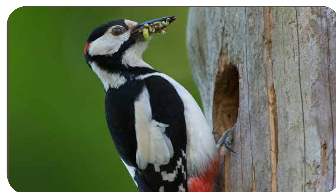
Större hackspett.

- Vi hackspettar gillar Björkelund. Kan du förstå varför? Kolla runt på tavlan och räkna hur många olika sorter du hittar. Året runt är vi här, utom en som bara är här på sommaren. Säkklart du snabbt listar ut vilken det är!