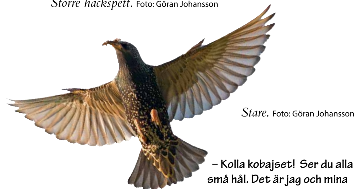
Stare.

- Kolla kobajset! Ser du alla små hål. Det är jag och mina kompisar, som flugit ut där.